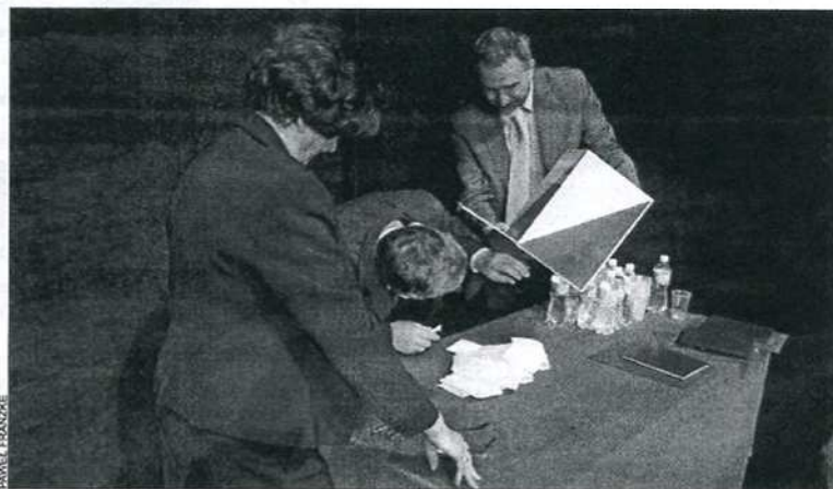
Komisja skrutacyjna zdawała się bardzo skrupulatnie liczyć głosy podczas inauguracyjnej sesji Rady Miasta. W rzeczywistości – za mylną podpowiedzią urzędowego prawnika – popełniła kolosalny błąd w liczeniu głosów.